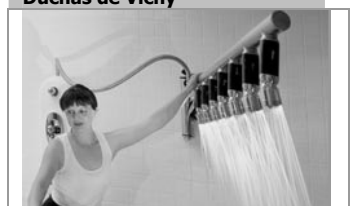
Duchas de Vichy