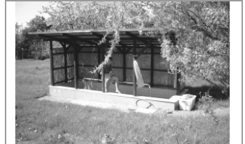
Baños de Kneipp